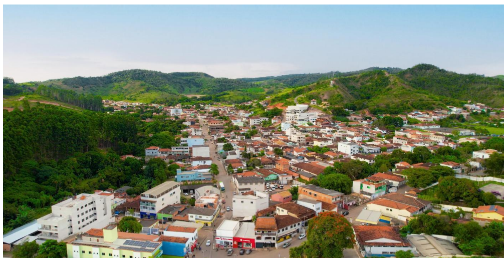
Figura 01 – Vista Panorâmica do município de Virginópolis

Em linhas gerais, Virginópolis está localizada dentro dos domínios Montanhosos e sua área urbana está assentada em um fundo de vale (Figura 3).