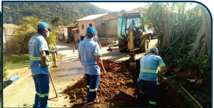
IMPLANTAÇÃO DE NOVA REDE DE DISTRIBUIÇÃO DE ÁGUA CRUZEIRO DO ARICANGA