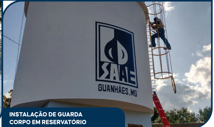
INSTALAÇÃO DE GUARDA CORPO EM RESERVATÓRIO