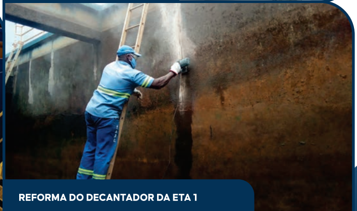
REFORMA DO DECANTADOR DA ETA 1