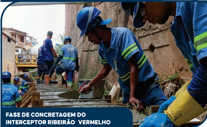
FASE DE CONCRETAGEM DO INTERCEPTOR RIBEIRÃO VERMELHO