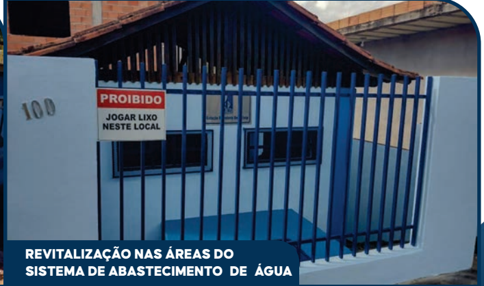
REVITALIZAÇÃO NAS ÁREAS DO SISTEMA DE ABASTECIMENTO DE ÁGUA