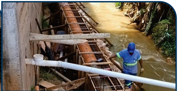
CONSTRUÇÃO INTERCEPTOR DE ESGOTO CENTRO