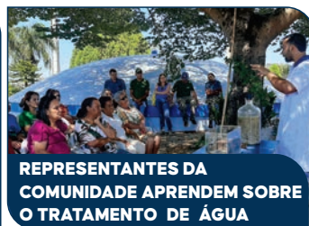
REPRESENTANTES DA COMUNIDADE APRENDEM SOBRE O TRATAMENTO DE ÁGUA