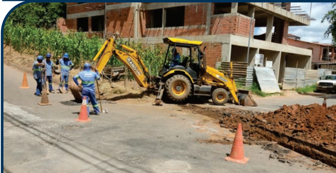
EXTENSÃO DE REDE DE ESGOTO AV. ALBERTO CALDEIRA