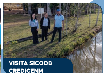
VISITA SICOOB CREDICENM