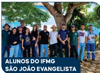
ALUNOS DO IFMG SÃO JOÃO EVANGELISTA

Por meio de intercâmbios entre SAAEs e visitas técnicas, o SAAE Guanhães fomenta uma troca de conhecimentos que amplia suas experiências e técnicas.