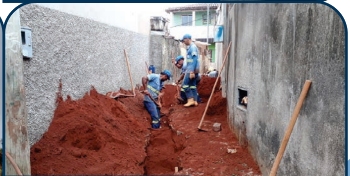
SUBSTITUIÇÃO DA REDE COLETORA DE ESGOTO DO BECO JOSÉ CIRILO ROCHA