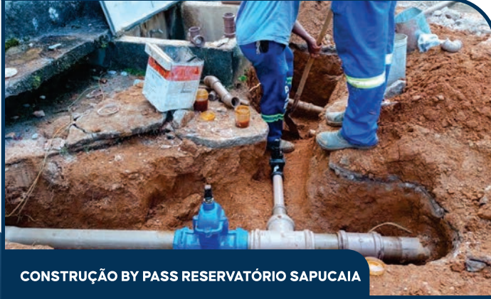
CONSTRUÇÃO BY PASS RESERVATÓRIO SAPUCAIA