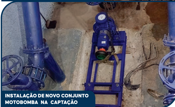
INSTALAÇÃO DE NOVO CONJUNTO MOTOBOMBA NA CAPTAÇÃO