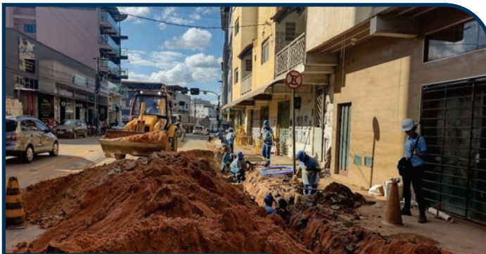
SUBSTITUIÇÃO REDE DE ESGOTO TRECHO AV. MILTON CAMPOS