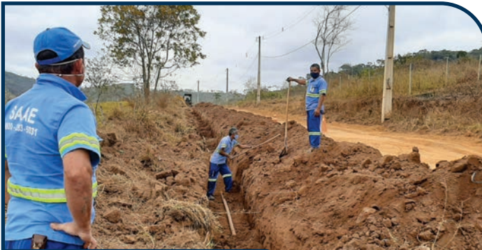
EXTENSÃO DE REDE DE ÁGUA E ESGOTO BAIRRO CANAÃ