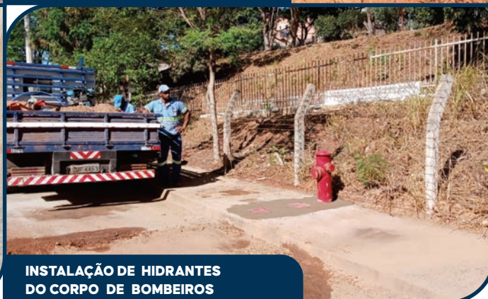
INSTALAÇÃO DE HIDRANTES DO CORPO DE BOMBEIROS