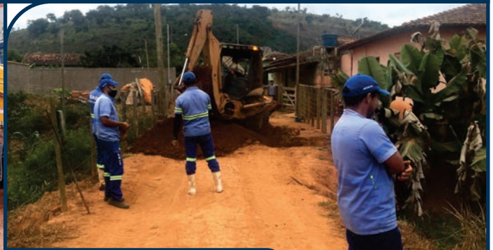
EXECUÇÃO DE REDE COLETORA DE ESGOTO NA BARREIRA