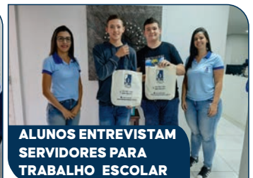
ALUNOS ENTREVISTAM SERVIDORES PARA TRABALHO ESCOLAR