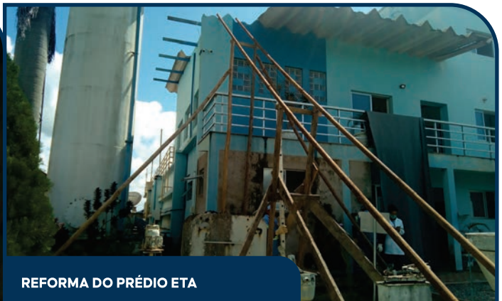
REFORMA DO PRÉDIO ETA