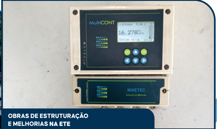
OBRAS DE ESTRUTURAÇÃO E MELHORIAS NA ETE