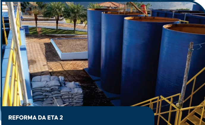
REFORMA DA ETA 2