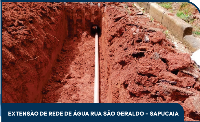
EXTENSÃO DE REDE DE ÁGUA RUA SÃO GERALDO - SAPUCAIA