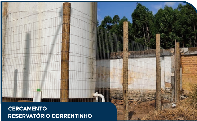
CERCAMENTO RESERVATÓRIO CORRENTINHO