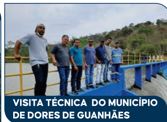
VISITA TÉCNICA DO MUNICÍPIO DE DORES DE GUANHÃES