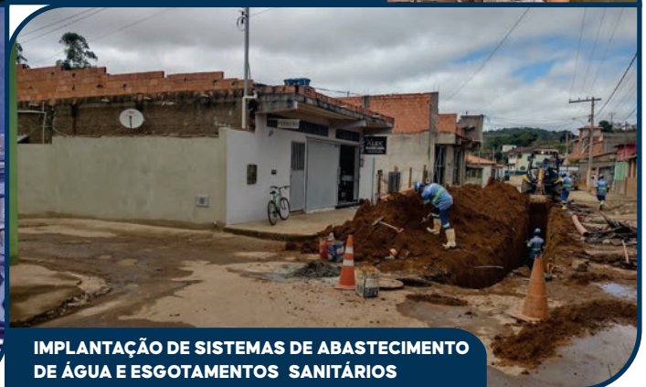
IMPLANTAÇÃO DE SISTEMAS DE ABASTECIMENTO DE ÁGUA E ESGOTAMENTOS SANITÁRIOS