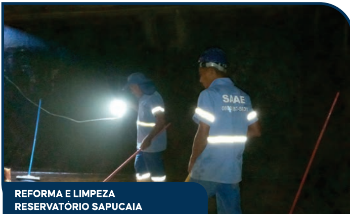
REFORMA E LIMPEZA RESERVATÓRIO SAPUCAIA