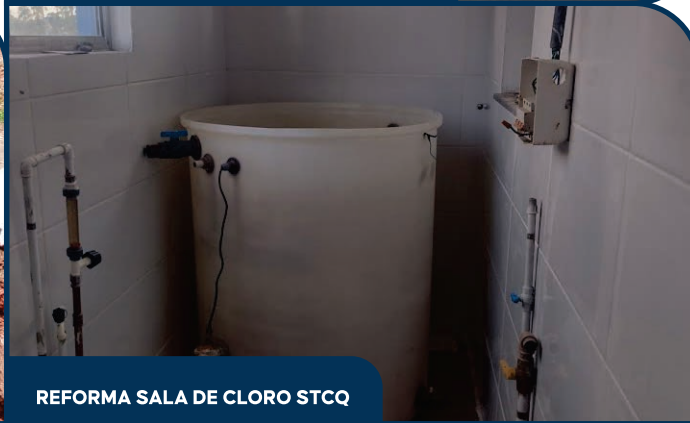
REFORMA SALA DE CLORO STCQ