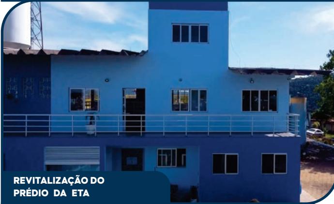
REVITALIZAÇÃO DO PRÉDIO DA ETA