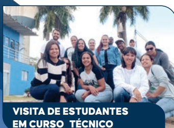
VISITA DE ESTUDANTES EM CURSO TÉCNICO