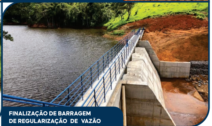
FINALIZAÇÃO DE BARRAGEM DE REGULARIZAÇÃO DE VAZÃO