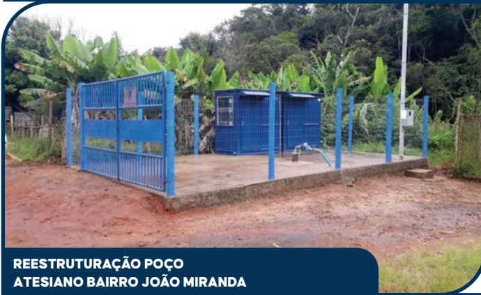
REESTRUTURAÇÃO POÇO ATESIANO BAIRRO JOÃO MIRANDA