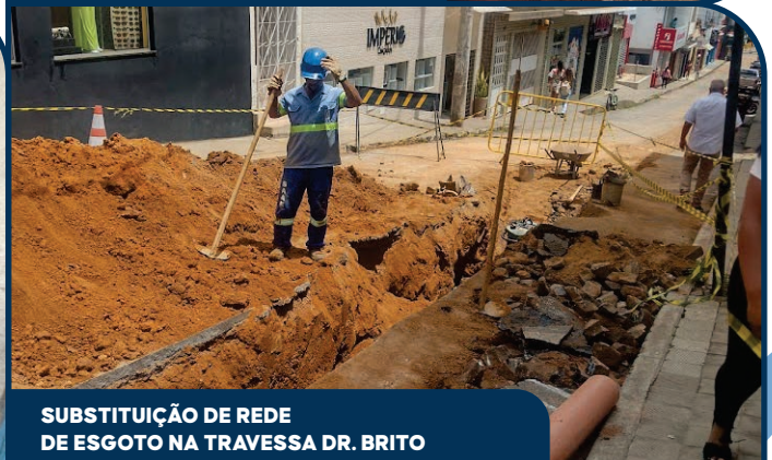
SUBSTITUIÇÃO DE REDE DE ESGOTO NA TRAVESSA DR. BRITO