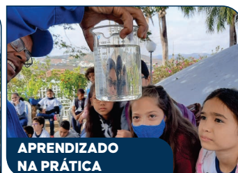
APRENDIZADO NA PRÁTICA