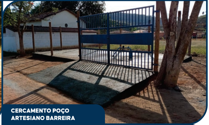
CERCAMENTO POÇO ARTESIANO BARREIRA