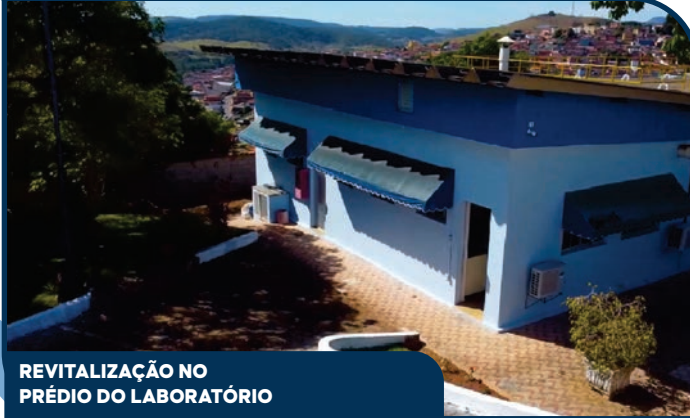
REVITALIZAÇÃO NO PRÉDIO DO LABORATÓRIO