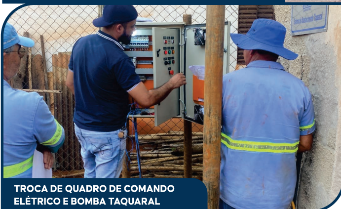
TROCA DE QUADRO DE COMANDO ELÉTRICO E BOMBA TAQUARAL