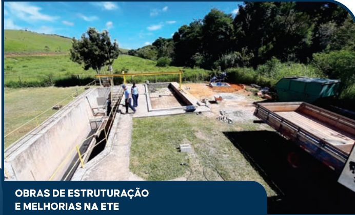
OBRAS DE ESTRUTURAÇÃO E MELHORIAS NA ETE