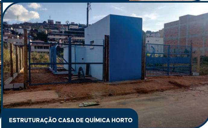
ESTRUTURAÇÃO CASA DE QUÍMICA HORTO