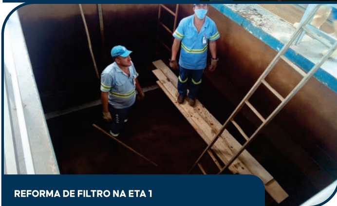
REFORMA DE FILTRO NA ETA 1