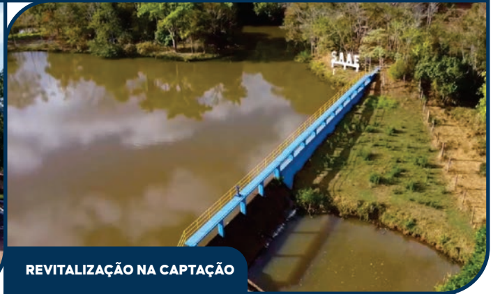
REVITALIZAÇÃO NA CAPTAÇÃO