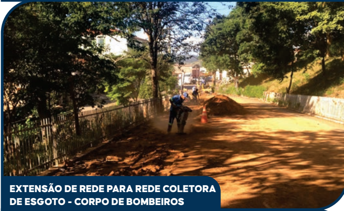
EXTENSÃO DE REDE PARA REDE COLETORA DE ESGOTO - CORPO DE BOMBEIROS