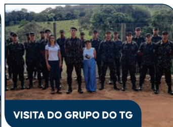
VISITA DO GRUPO DO TG