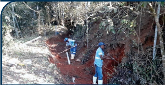
IMPLANTAÇÃO DE REDE PARA CANALIZAÇÃO DE ÁGUA BARRAGEM SANTA CRUZ