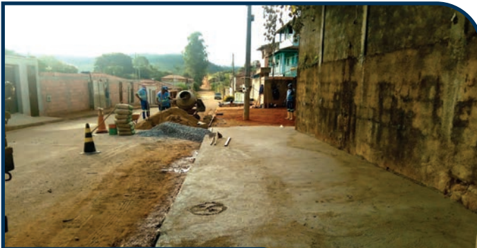
MANUTENÇÃO DE ÁREA EXTERNA DO SOMEX