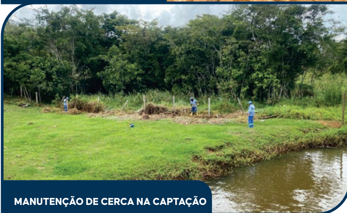
MANUTENÇÃO DE CERCA NA CAPTAÇÃO