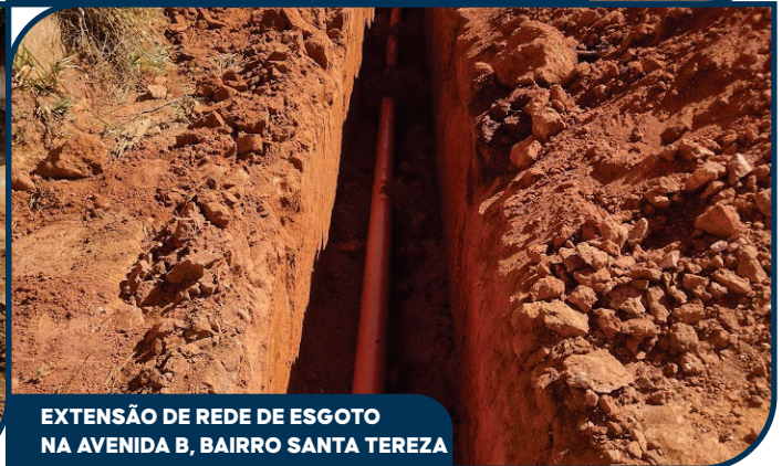
EXTENSÃO DE REDE DE ESGOTO NA AVENIDA B, BAIRRO SANTA TEREZA