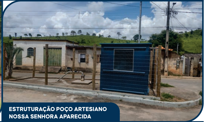
ESTRUTURAÇÃO POÇO ARTESIANO NOSSA SENHORA APARECIDA