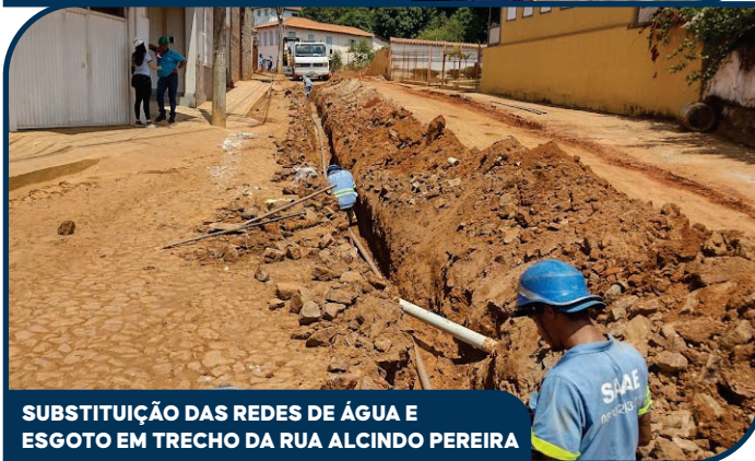
SUBSTITUIÇÃO DAS REDES DE ÁGUA E ESGOTO EM TRECHO DA RUA ALCINDO PEREIRA