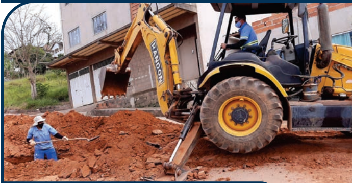
EXECUÇÃO DE NOVA REDE COLETORA DE ESGOTO NA RUA SETE NO BAIRRO SANTA TEREZA