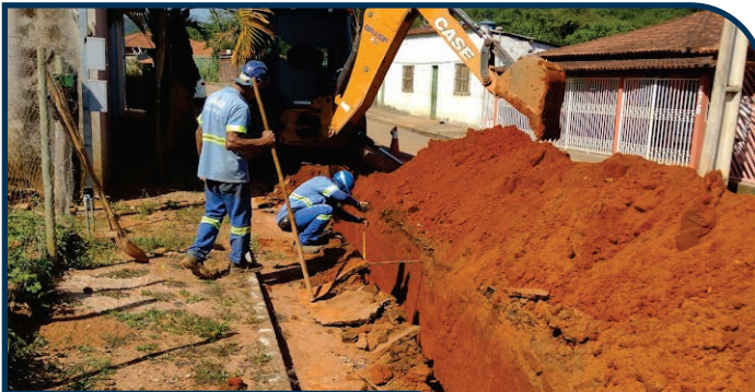
EXTENSÃO DE REDE DE ESGOTO BAIRRO MADEIRA