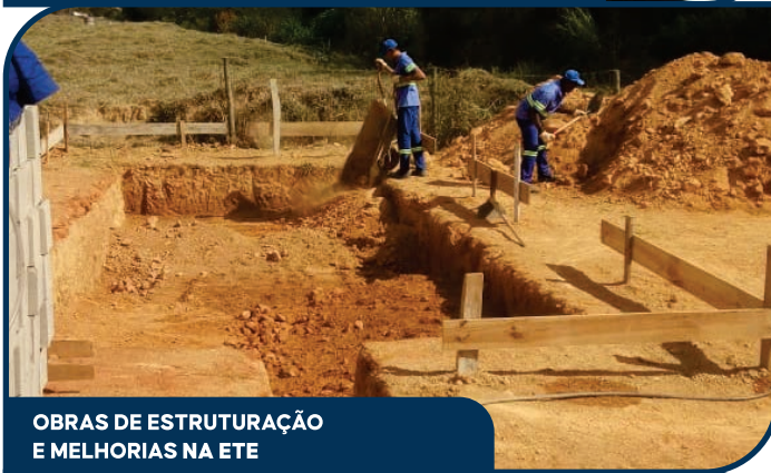
OBRAS DE ESTRUTURAÇÃO E MELHORIAS NA ETE