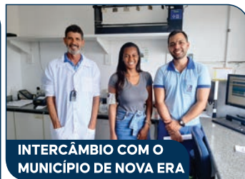
INTERCÂMBIO COM O MUNICÍPIO DE NOVA ERA