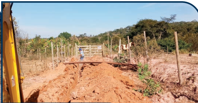
EXTENSÃO DE REDE DE ÁGUA BAIRRO NOVA UNIÃO