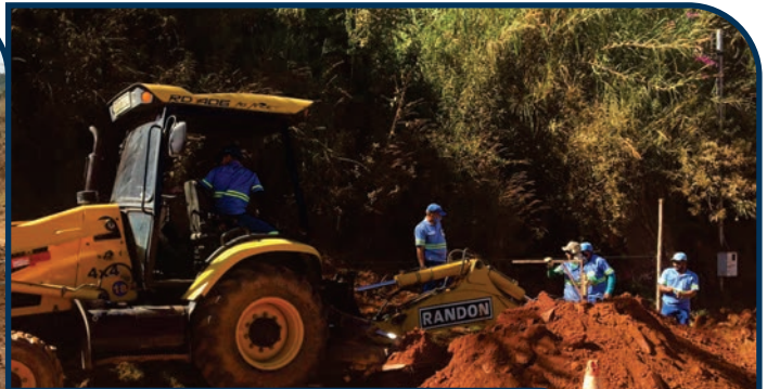
EXTENSÃO DE REDE DE ESGOTO EM CORRENTINHO