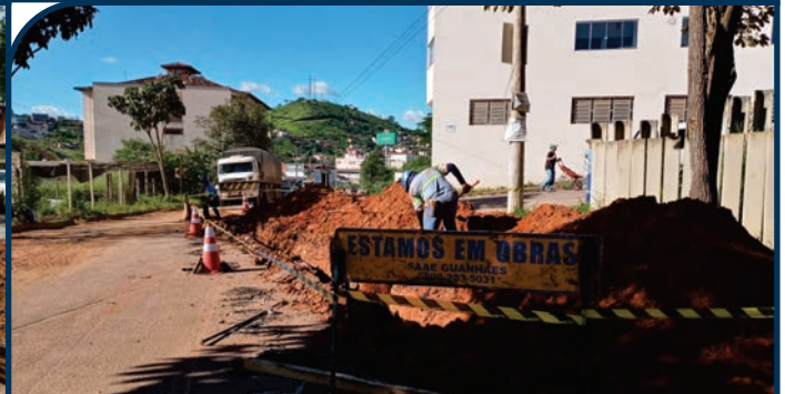
EXTENSÃO DE REDE DE ESGOTO BAIRRO JARDINS