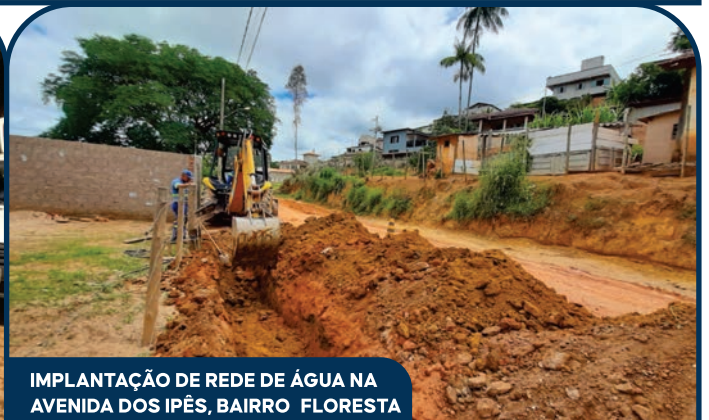
IMPLANTAÇÃO DE REDE DE ÁGUA NA AVENIDA DOS IPÊS, BAIRRO FLORESTA