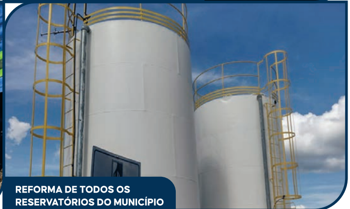
REFORMA DE TODOS OS RESERVATÓRIOS DO MUNICÍPIO