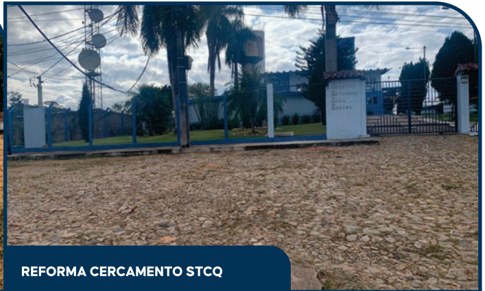
REFORMA CERCAMENTO STCQ