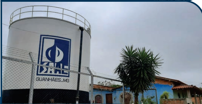
REFORMA RESERVATÓRIO DO AMAZONAS