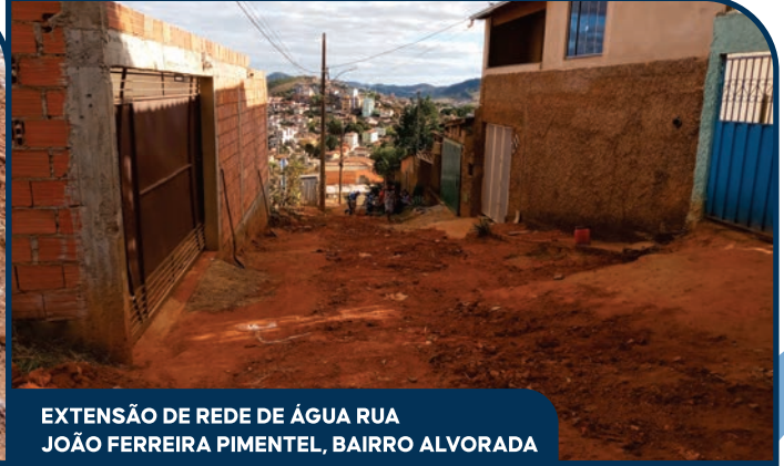
EXTENSÃO DE REDE DE ÁGUA RUA JOÃO FERREIRA PIMENTEL, BAIRRO ALVORADA