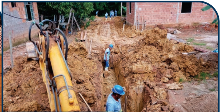
EXTENSÃO DE REDE DE ÁGUA E ESGOTO BECO DEUS É FIEL