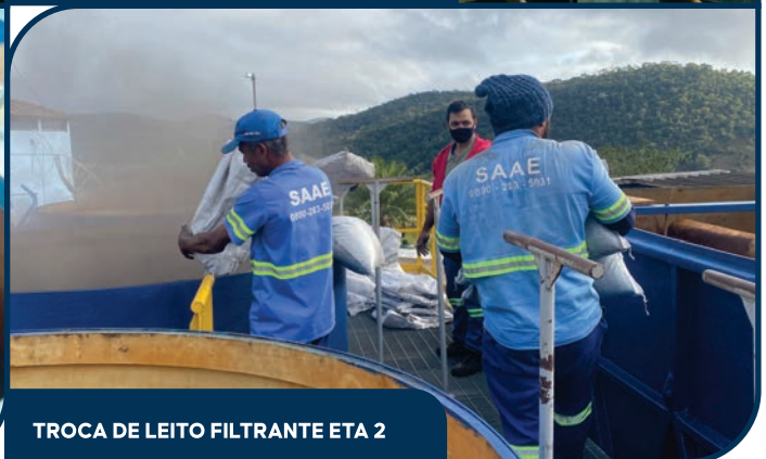
TROCA DE LEITO FILTRANTE ETA 2