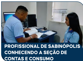
PROFISSIONAL DE SABINÓPOLIS CONHECENDO A SEÇÃO DE CONTAS E CONSUMO