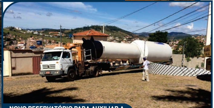
NOVO RESERVATÓRIO PARA AUXILIAR A ESTAÇÃO DE TRATAMENTO DE ÁGUA (ETA), NA LAVAGEM DE FILTROS