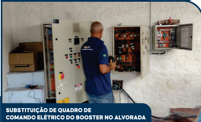
SUBSTITUIÇÃO DE QUADRO DE COMANDO ELÉTRICO DO BOOSTER NO ALVORADA