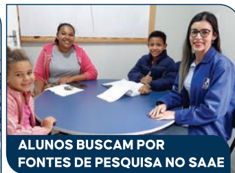
ALUNOS BUSCAM POR FONTES DE PESQUISA NO SAAE