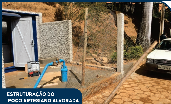
ESTRUTURAÇÃO DO POÇO ARTESIANO ALVORADA