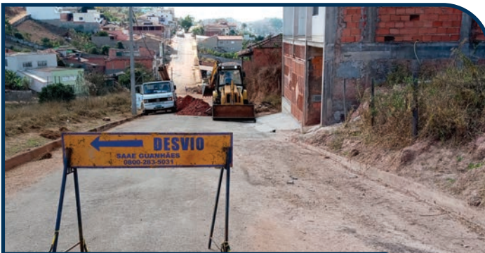
EXTENSÃO DE REDE DE ESGOTO DE ÁGUA E ESGOTO BAIRRO SANTA TEREZA