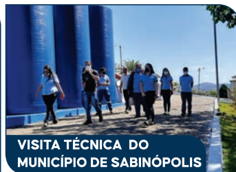
VISITA TÉCNICA DO MUNICÍPIO DE SABINÓPOLIS