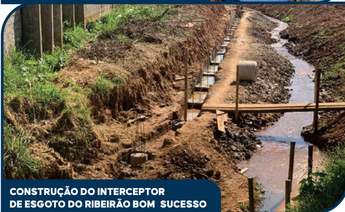
CONSTRUÇÃO DO INTERCEPTOR DE ESGOTO DO RIBEIRÃO BOM SUCESSO