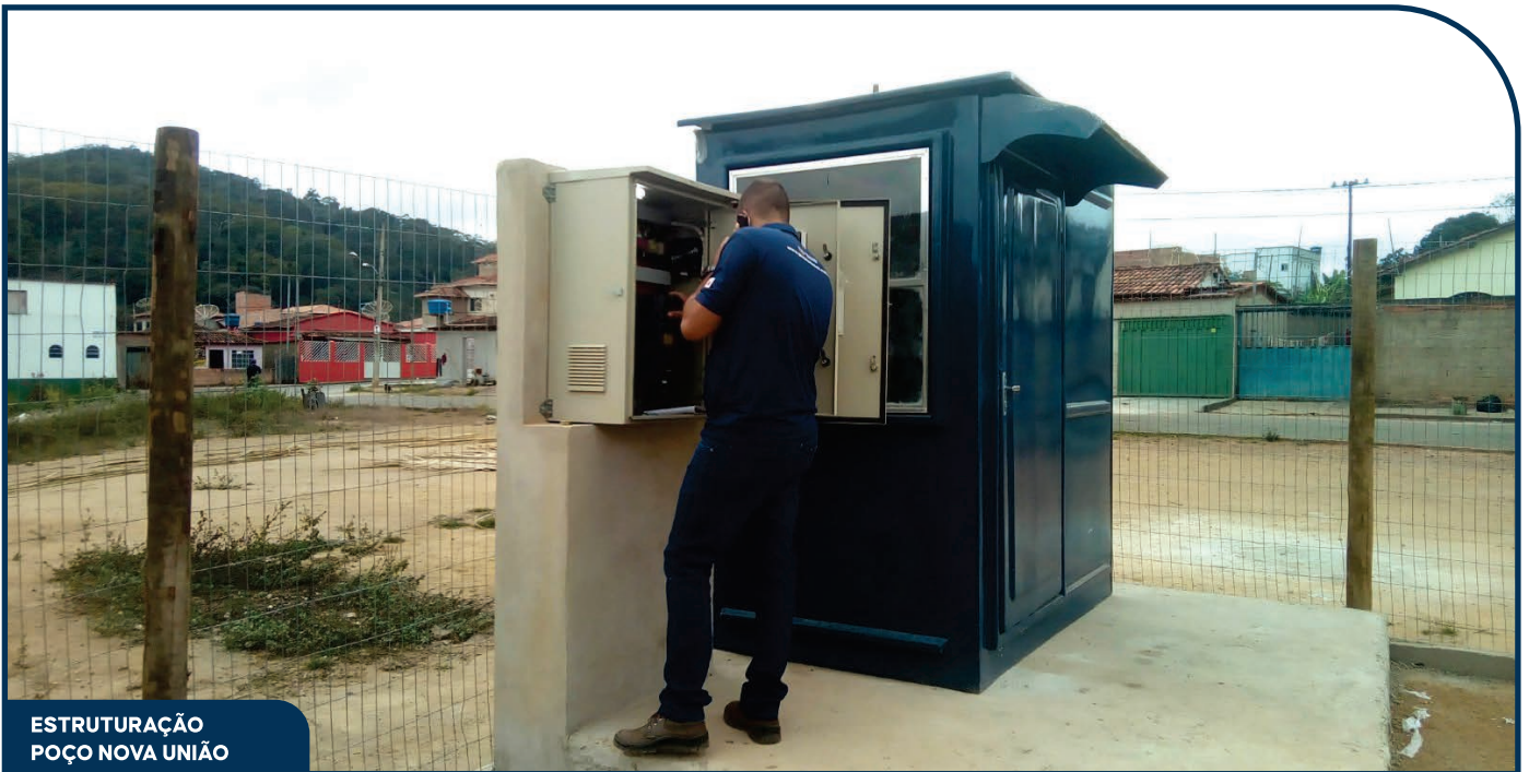
ESTRUTURAÇÃO POÇO NOVA UNIÃO