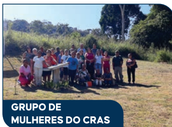
GRUPO DE MULHERES DO CRAS