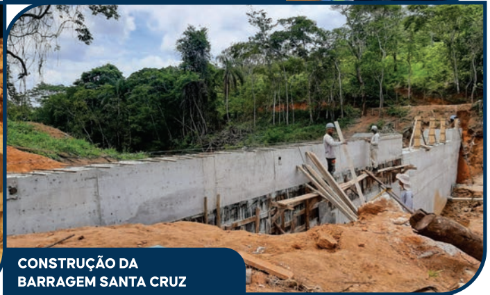
CONSTRUÇÃO DA BARRAGEM SANTA CRUZ