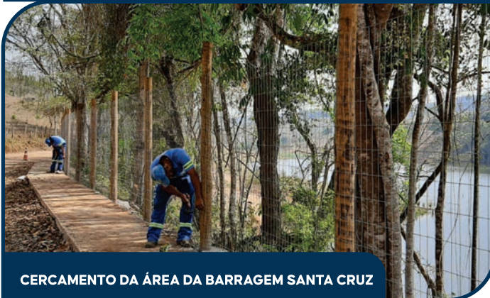
CERCAMENTO DA ÁREA DA BARRAGEM SANTA CRUZ