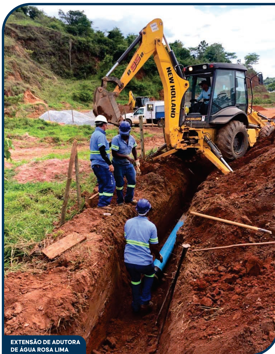
EXTENSÃO DE ADUTORA DE ÁGUA ROSA LIMA

Nas páginas a seguir, confira as principais obras e serviços realizados pelo SAAE no período da atual gestão. Cada imagem revela o compromisso da Autarquia.